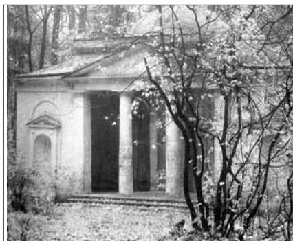
Павильон «Нерастанкино» Арх. И.В. Егоров. 1803–1804 гг.

Этим загадочным именем назван второй павильон в царьцынском парке, который в XIX веке называли также «Миранкино» или «Вторая Миловиды». Строивший его архитектор И.В. Егоров и инициатор постройки граф П.С. Валуев называли его «галереей с кабинетами». Каж-