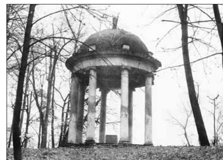
Храм Цереры (беседка «Золотой сноп») Арх. И.В. Егоров. 1805 г.