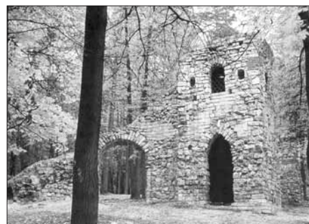
Башня-руина Арх. И.В. Егоров. 1804–1805 гг.

Как пишет И.Е. Забелин, башня была «внизу убрана разного цвета мохом... против нее внизу внутри горы