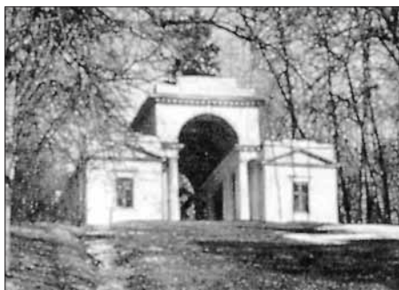
Павильон «Миловида». Арх. И.В. Егоров. Нач. XIX в.

Из этой беседки действительно открывается милый, удивительный вид на окрестности. Небольшой насыпной остров притягивает взор путника. Еще в 1825 году этот павильон был пре-