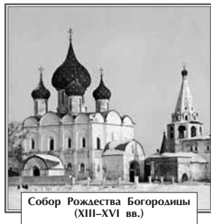
Собор Рождества Богородицы (XIII–XVI вв.)

Стоит только оказаться в черте города, сразу теряется представление о времени и пространстве, создается ощущение, что все здесь не от мира сего. Небо кажется голубее, воздух чище и прозрачнее, здесь даже днем видны звезды. Да, не удивляйтесь! Когда-то зодчие-мечтатели, чтобы, наверное, никогда не забывать о звездном небе, воссоздали его на куполах Рождественского собора.