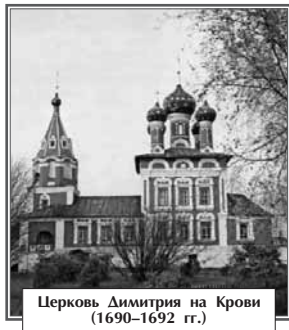
Церковь Димитрия на Крови (1690–1692 гг.)