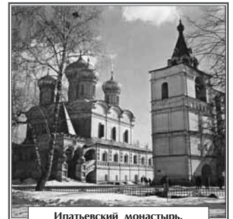
Ипатьевский монастырь. Троицкий собор (1650–1652 гг.)

Но жемчужиной Костромы был и остается Ипатьевский монастырь. Его главный храм уже несколько столетий служит усыпальницей роду Годуновых; гостеприимные стены монастыря в Смутное время дали приют 16-летнему Михаилу Федоровичу Романову; именно сюда в 1613 г. прибыло посольство Земского собора с вестью об избрании Михаила Романова на царский престол.